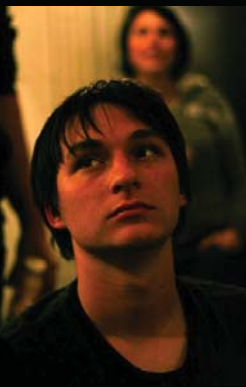
kluk z plakátu