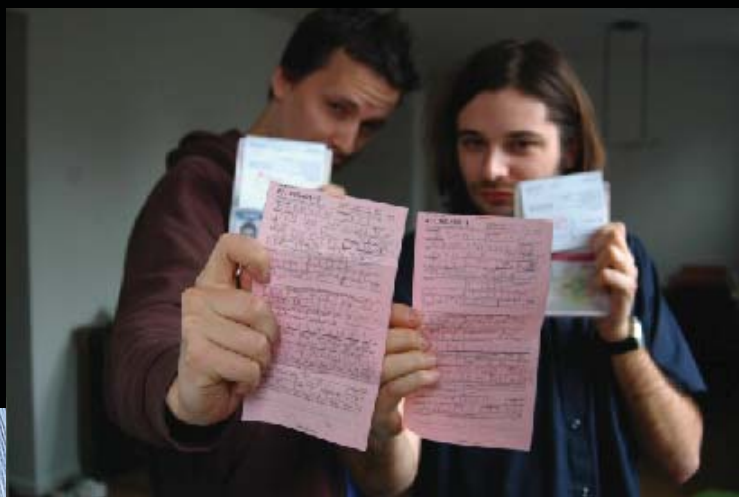
urinating in public