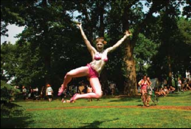
aktivní relax v Central Parku