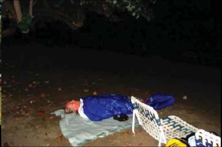
pasivní relax v Central Parku