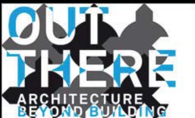
poutač na bienále architektury